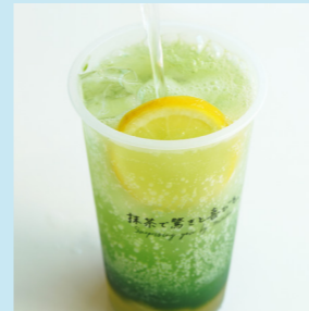
抹茶レモンソーダ Matcha Lemon Soda ¥530 (税込)