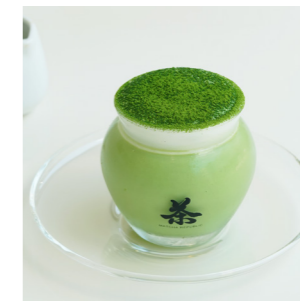
茶壺の抹茶パannaコッタ ¥630 (税込) Matcha panna cotta Milk