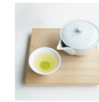
煎茶青雫 ¥600 (税込) SENCHA AOSHIZUKU 軽やかな旨味と香り 日本茶award 受賞茶 宇治煎茶 ¥700 (税込) UJI SENCHA 伝統製法で仕上げたワンランク上のこだわりの宇治煎茶