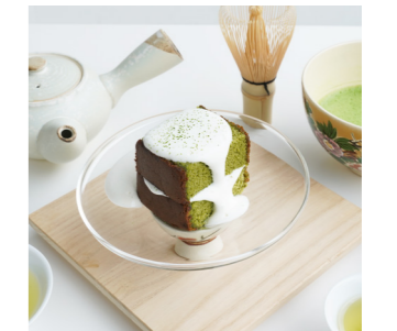
抹茶カステラ ¥480 (税込) Matcha Castella Milk, Egg, Wheat

ドリンク 購入後 1時間以内にお召し上がり Drinks : Please serve them within one hour of purchase.