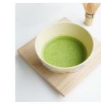
抹茶 ¥700 (税込) MATCHA 宇治抹茶の持つ深みと香りでひと休み