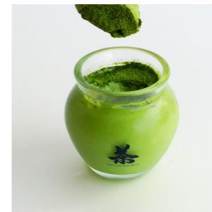
茶壺の抹茶ティラミス ¥680 (税込) Matcha tiramisu Milk, Egg, Wheat