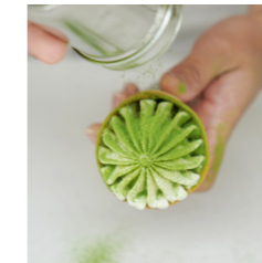
▶ミルククレミアに 宇治茶 直がけ Powder Topping