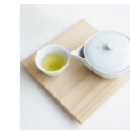
玉露 ¥700 (税込) GYOKURO 本格宇治玉露で贅沢な時間を